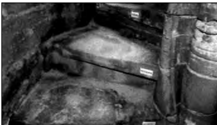
Schäden an der Spindel/ Laufbereich mit Fehlstellen

Carsten Sußmann, Dipl.-Ing. Dombauleitung Magdeburg im Januar 2012