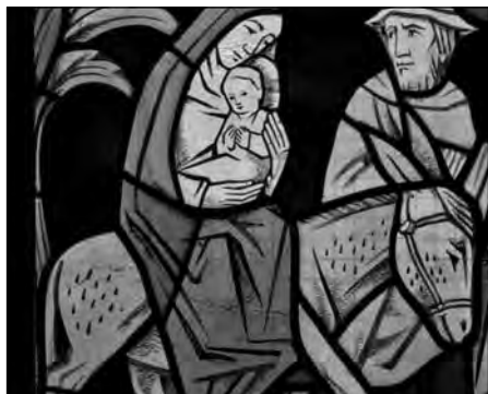
Bei der Scheibe „Flucht nach Ägypten“ sind deutliche Sprünge im Glas zu erkennen

Wenn das Wetter es zulässt, werden einige Scheibensegmente entnommen und zur speziellen Untersuchung zu einem Spezialisten gebracht. Erst nach dem genauen Befund der Bleiglasscheiben kann die Ausschreibung für die Bleiverglasung und die Sandsteinarbeiten vorbereitet werden. Der Förderverein hofft, dass die Arbeiten in diesem Jahr an allen fünf Fenstern durchgeführt werden können.