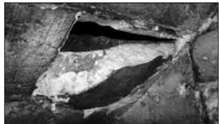
Großflächige Ausbrüche im Laufbereich