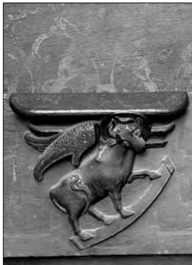
Evangelist Lukas (Chorgestühl, um 1360)